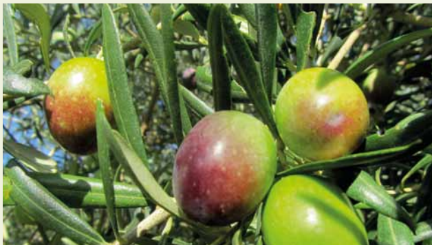
Oliven mit bestem Reifegrad für aromatisches Olivenöl

Den Olivenbaum, wie wir ihn vor allem aus den alten Hai- nen des Mittelmeerraums kennen, gibt es ohne die unabläs- sige Bearbeitung durch die Menschen nicht – die Wildform wächst als Busch. Die Kulturform des Olivenbaumes entstand vermutlich im Zwei-Strom-Land zwischen Euphrat und Ti- gris, in einer Region also, in deren Umkreis sich auch die drei großen monotheistischen Weltreligionen entwickelt ha- ben. In diesen Religionen haben der Olivenbaum und seine ölhaltigen Früchte sehr früh eine symbolische und sakrale Bedeutung erhalten. Das Alte Testament zeugt mit seinen vielfältigen Erzählungen und Beschreibungen zur Herstel- lung von Salbölen und ihrer Verwendung für religiöse Riten davon, aber auch von der Kultivierung des Busches zu einem Baum, von seiner Pflege, von der Ernte und der Gewin- nung des Olivenöls.