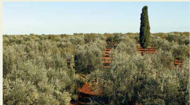
Olivenbäume prägen das Landschaftsbild vieler mediterraner Regionen

Zu allen Zeiten wurde die herausgehobene Bedeutung des Olivenöls mit seinem Non-Food-Nutzen beschrieben, weit weniger sein Wert als Nahrungsmittel oder gar der Genuss seiner reichhaltigen Inhaltsstoffe. Die Jahrtausende währen- de Olivenölgewinnung mit Steinmühlen, Mattenpressen und Absetzbecken erlaubte es gar nicht, ein wirklich schmack- haftes Produkt zu erzeugen. Die Oxidation konnte nicht unterbunden werden, sie wurde durch die Methoden sogar beschleunigt, so dass die Olivenöle von Anbeginn überreif waren und schnell ranzig wurden. Erst mit der Einführung der Zentrifuge ab den 1960iger Jahren, die schnell das Öl vom Wasser trennen konnte, eröffneten sich Wege, Olivenöl auch als Nahrungsmittel neu zu entwickeln.