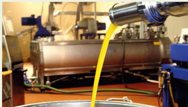
Moderne Olivenmühlen sind teure high-tech Anlagen

ein Natives Olivenöl Extra sein, wobei „nativ“ für die Gewinnung nur mit mechanischen Verfahren und ohne Wärmebehandlung steht. In Qualitätsabstufungen werden dann weitere Klassen definiert.